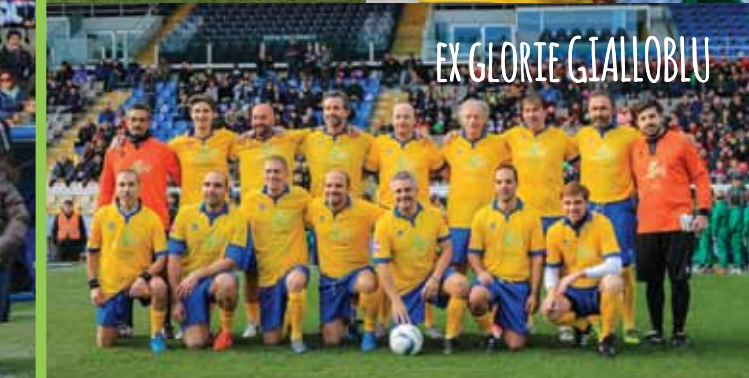
EX GLORIE GIALLOBLU