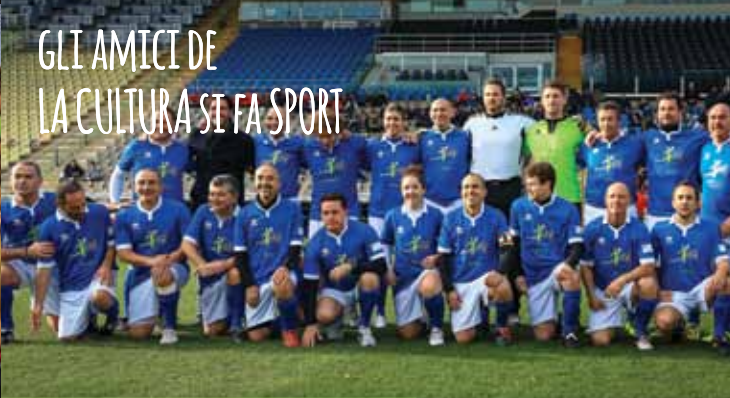
GLI AMICI DE LA CULTURA SI FA SPORT