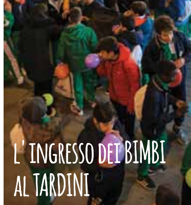
L'INGRESSO DEI BIMBI AL TARDINI